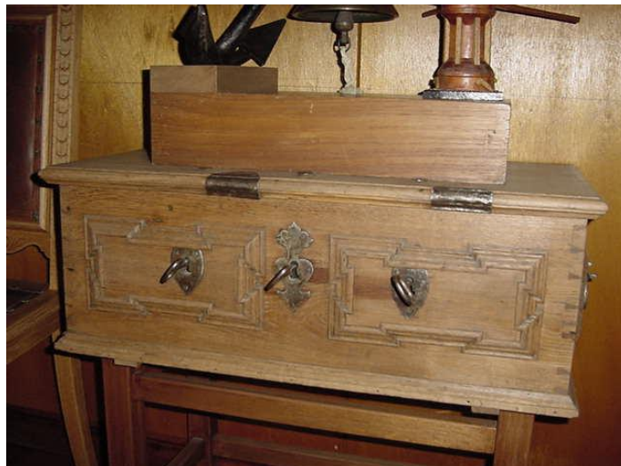
(Foto av författaren 4/10-01 bild av kassakistan. Skeppare Societetens arkiv.)

En speciell kassalåda anskaffades 1775 med tre nycklar. Dessa tre olika nycklar innehades av tre personer i styrelsen som hade varsin nyckel. I denna låda förvarades alla pengar som betalades in av medlemmarna. Kassalådan finns kvar än idag och finns hos Skeppare Societeten men endast som ett fint minne.