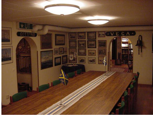
(Skeppare Societetens sammankomstrum, foto taget av författaren 4/10-01).