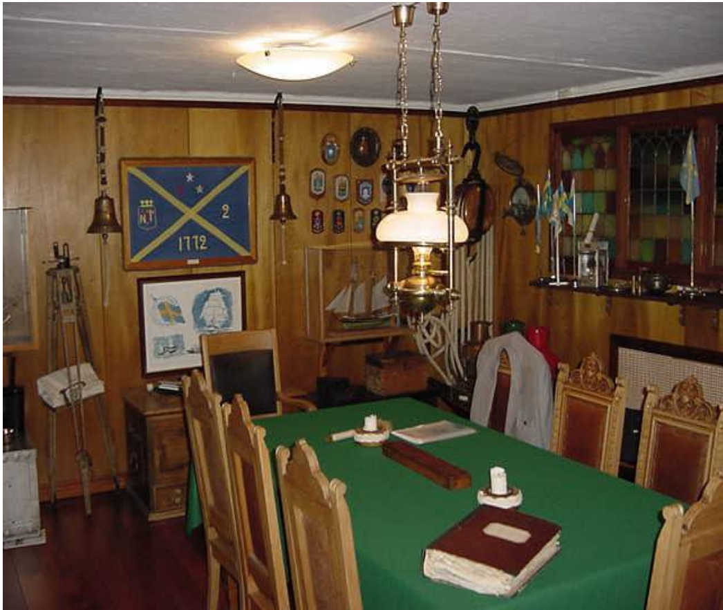
(styrelserummet Skeppare Societeten. 4/10-01.)